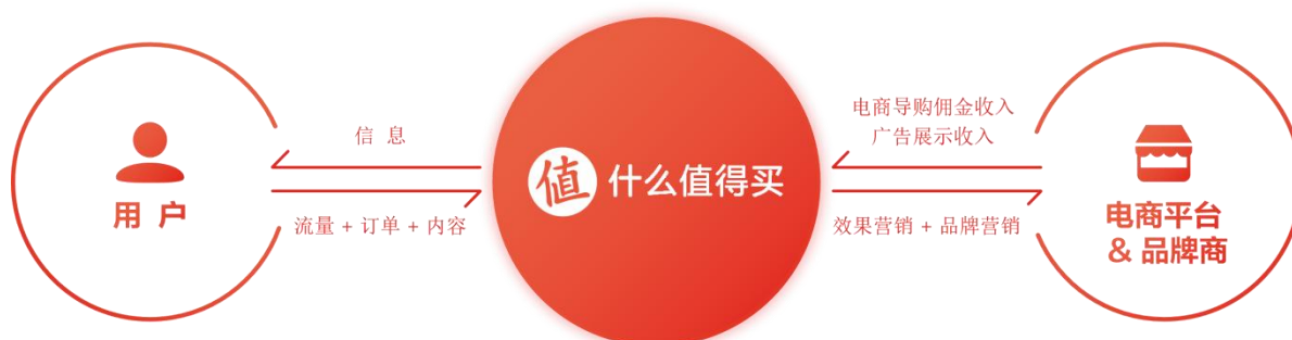
图：“什么值得买”盈利模式

公司网站和移动应用直接展示电商平台、品牌商等客户的相关商品或服务信息，将用户引流至电商平台、品牌商官网，根据用户实际完成交易金额的一定比例向电商平台、品牌商等获取的收入；广告展示收入是指通过在公司网站和移动应用为电商平台、品牌商等客户提供广告展示等营销服务，向电商平台、品牌商等客户获取的收入。