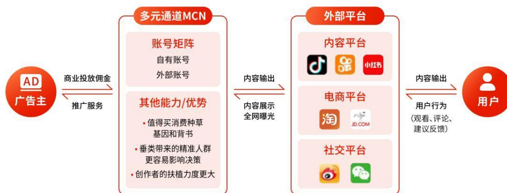
图：多元通道盈利模式

公司的消费类MCN业务主要通过旗下子公司多元通道开展，多元通道专注于垂直品类的消费内容，致力于在全网构建具有影响力的消费内容账号矩阵，打造聚焦泛消费领域的MCN。多元通道的内容账号矩阵立足于满足用户丰富的消费需求和多元化的消费场景，通过孵化自有账号与签约外部账号相结合的方式，与公司内部的内容专家以及外部达人等展开合作，为其提供包含内容创意及制作、商业内容生产变现、培训交流、供应链资源、法务、公关等在内的服务支持，帮助其在国内主要短视频、电商平台进行内容推广，扩大粉丝规模。在此基础上，多元通道通过旗下账号为品牌商提供品牌营销服务实现商业化变现。该类收入体现为品牌营销收入。