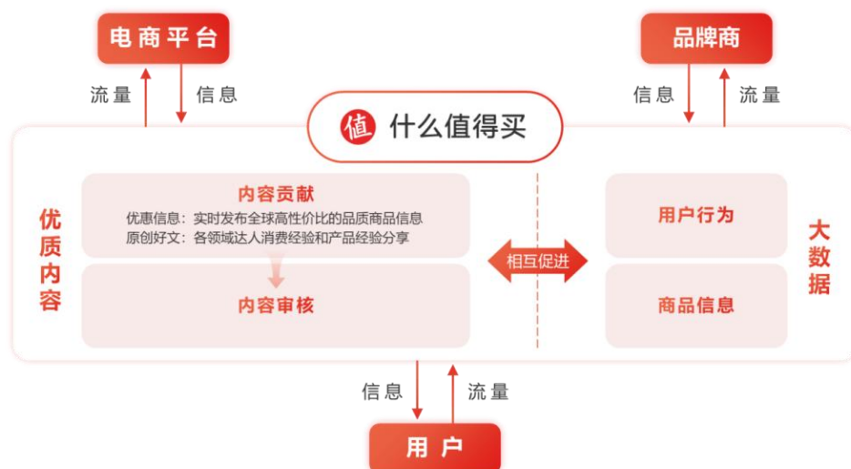
图：“什么值得买”商业模式

“什么值得买”是一个由用户驱动的消费内容社区，通过用户的消费经验分享和互动，让来自用户的真实声音帮助更多用户理性、高效决策，实现良性循环。目前，“什么值得买”已经形成了以“科学消费”为价值导向的消费内容创作生态，积累了一批高黏性、高质量、高活跃度的用户群体和有价值、有温度的消费内容。2023年，站内来自于用户贡献的内容（UGC）发布量占比57.49%，用户每天不断在平台上分享实用的购物攻略、专业的评测报告、真实的晒物体验、开箱视频以及精选的新品资讯等内容，为更多用户的日常购物决策提供辅助，并以此获得认同与价值共鸣，形成了“科学消费、认真生活”的社区文化，成为了很多用户的科学消费指南。此外，自2017年开始，“什么值得买”开始尝试通过算法和机器的方式生产内容，即MGC（Machine-Generated Content，机器贡献内容），现更名为AIGC（Artificial Intelligence Generated Content，人工智能生成内容）。2023年，AIGC内容的占比达到了36.66%，已经成为增加社区内容数量和丰富社区内容生态的重要组成部分。